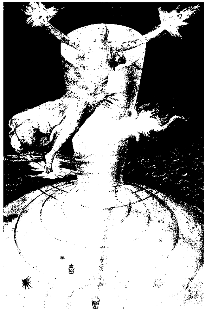
La creación del cielo y la separación de las aguas en el cielo. Con este título el artista Francisco de Holanda bautizó una de las acuarelas destinadas a la obra De Aetatibus Mundi Imagines publicada entre 1545 y 1573 y dedicada al relato bíblico de la creación del mundo en pleno debate teológico entre católicos y protestantes.

Por su parte, el profesor italiano Constantino Esposito hace énfasis en que la impronta que el discurso metafísico de Suárez ha dejado en las escuelas europeas del XVII ha sido paradójica, pues siendo la referencia obligada para el renacer de la metafísica católica postridentina, no lo ha sido menos para la formación filosófica protestante. Este doble destino se explicaría por el carácter neutro de la ontología propuesta por Suárez, lo que permite a la disciplina metafísica realizar un ejer-