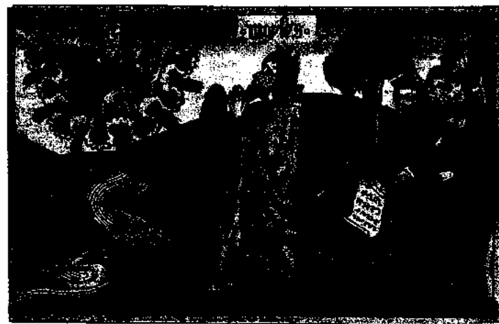
Dios y Moisés en una de las imágenes que ilustran la Biblia de Lutero. Suárez, en las Disputaciones , resolvió brillantemente la compleja polémica teológica entre la tesis católica del libre albedrío y la luterana de la predestinación realizando una interpretación ecléctica de ambas teorías, dentro de la ortodoxia romana.

der divino y la libertad humana. Lutero, oponiéndose al pelagianismo y apoyándose en san Pablo, había afirmado que las criaturas humanas no pueden hacer nada por sí mismas respecto a la obra de la redención, por lo que una naturaleza humana corrompida por el pecado original y la concupiscencia se ve impotente, si no es directamente suprimida por la gracia divina. Esta doctrina era claramente contraria al tomismo, donde la gracia, lejos de suprimir la naturaleza ( gratia non tollit naturam ), la perfecciona. Los teólogos españoles, enfrentados, pues, con el reto luterano, continuarán la indagación sobre la necesaria compatibilidad entre el libre arbitrio de la criatura humana y el mantenimiento de la absoluta omnipotencia divina, en un debate que en ese momento habría de tener fuertes consecuencias no sólo en el plano teológico o filosófico, sino también en el ético y político.