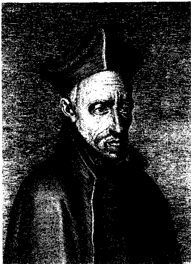
R. P. FRANCISCVS SVAREZ Granatenfis E SOCIETATE IESV DOCTOR THEOLOGVS et in Cornimbricenfí Academia primarius Profefflor Obijt anno 1617. 25. Septembris, ætatis fere 70.

Retrato del jesuita granadino que ya en vida obtuvo el reconocimiento oficial como Doctor Eximio gracias a su labor como juriconsulto especializado en la definición de una nueva jerarquía legislativa y, como teólogo, en su condición de máximo representante de la corriente filosófica denominada «escolástica del Barroco».