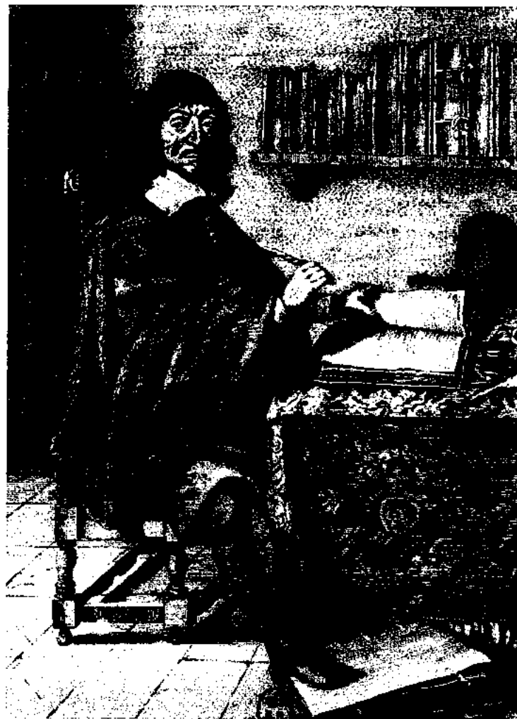
Retrato de René Descartes (1596-1650). Desde finales del siglo XIX todos los estudios especializados y los análisis comparativos filosóficos confirman la decisiva influencia del renovado pensamiento escolástico de Suárez en el racionalismo cartesiano.