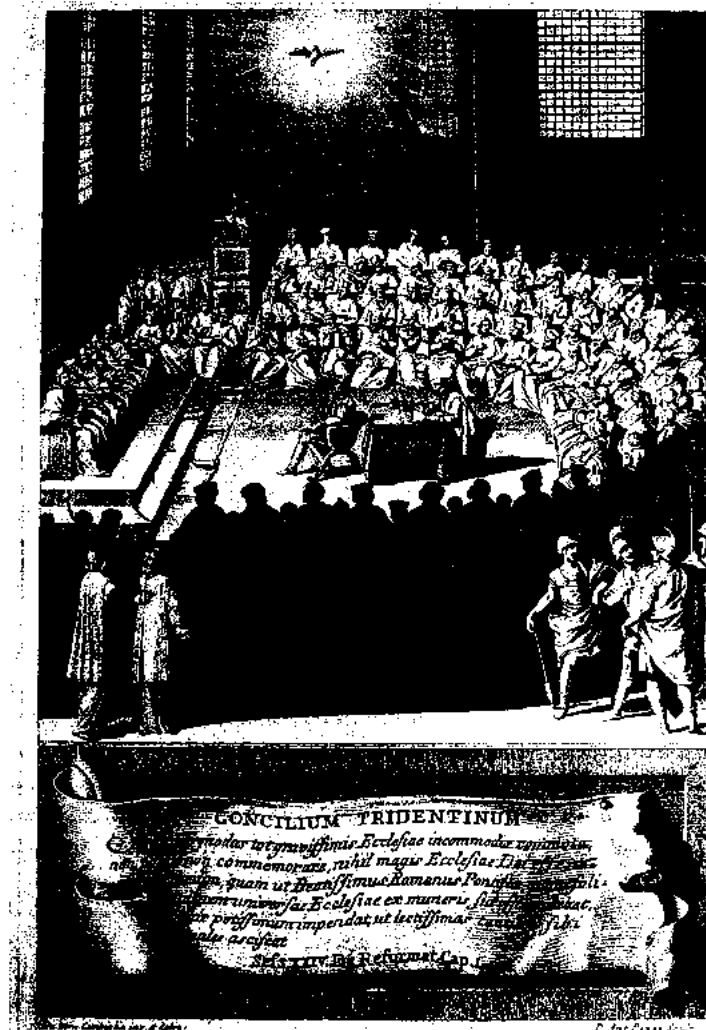
Grabado que recoge una de las sesiones del Concilio de Trento celebrado entre los años 1545 y 1563 como respuesta del catolicismo romano al proceso reformista iniciado en los países del centro de Europa y cuyas conclusiones generarían una brillante nómina de teólogos y filósofos entre los que destacó Francisco Suárez.

Nacido el 5 de enero del año 1548 en el seno de una familia castellana que se encontraba en Granada, donde había recibido posesiones del emperador por los viejos servicios prestados en la guerra contra la invasión musulmana, Suárez, a penas a los diez años, inició sus estudios en la Facultad de Derecho de la Universidad de Salamanca, que había llegado a convertirse en el centro académico más prestigioso de Europa junto a la Universidad de París. En 1564 solicita entrar en la Compañía de Jesús, pero, en un primer momento, su solicitud es denegada debido a que sus resultados académicos eran insuficientes. Poco después, sin embargo, su insistencia logra superar los obstáculos y es admitido, comenzando su noviciado en la casa de Medina del Campo (Valladolid). Allí comienza a mostrar su verdadera capacidad intelectual e inicia sus estudios en filosofía en Salamanca. En este momento, lo que el novicio entiende como una gracia divina le impulsa a superar las dificultades de los estudios, de modo que, tras dos años, inicia los estudios de teología con el maestro dominico Juan Mancio (1497-1576), que había sucedido a Francisco de Vitoria (c. 1486-1546), y seguía fielmente la enseñanza de Tomás