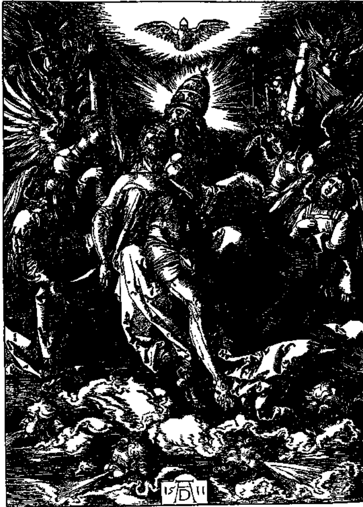
La Trinidad , grabado de Alberto Durero inserto en la tradición iconográfica cristiana, relaciona la existencia de las tres personas divinas reunidas en un solo ser. Como debate filosófico, este dogma, junto con multitud de otros argumentos metafísicos, está presente en las Disputaciones suarécianas.

ser o de la metafísica teológica, como los contenidos objetivos de la naturaleza divina, sus operaciones sustanciales y sus procesiones trinitarias, sólo han podido ser abordados desde la perspectiva del fuerte aparato metodológico proporcionado por las distinciones, características de cada escuela y de cada autor, al mismo tiempo retomadas una y otra vez y recreadas en sus aparentemente leves variaciones.